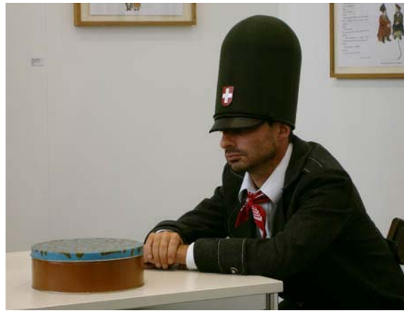
« Geopoetics IV », performance au Latvian Centre for Contemporary Art, 2005