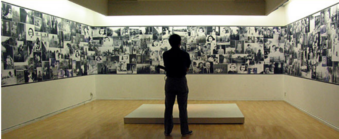
« Geopoetics II », Biennale de Shanghai, 2004