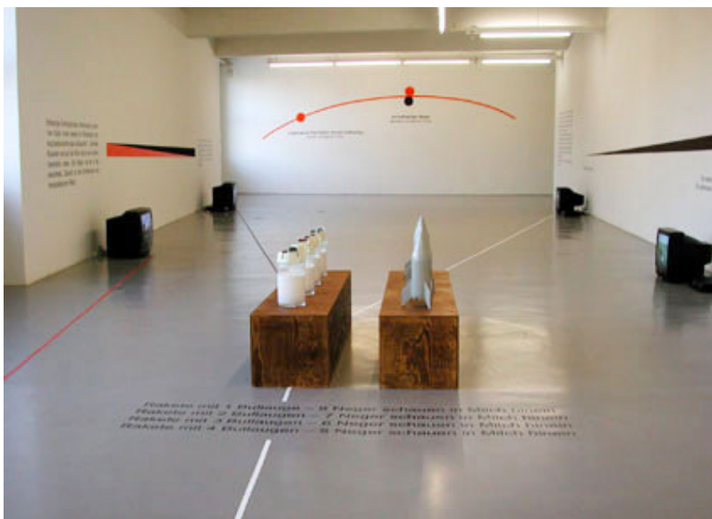
Vue de l'installation au GAK (Brême, Allemagne), 2003