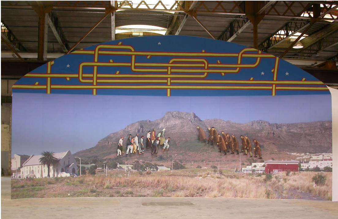
«Les victimes de Katyn et les victimes de Hatyn se rencontrent sur les collines poussiéreuses des environs de Cap Town», installation, 2005