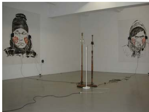
Vue de l'installation « Les noms des électrons (esquimo-wagnérien) », 1999-2000