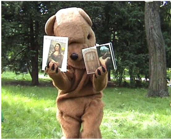
Duchamp le Hassidique, vidéo, 1988, courtesy galerie Michel Rein