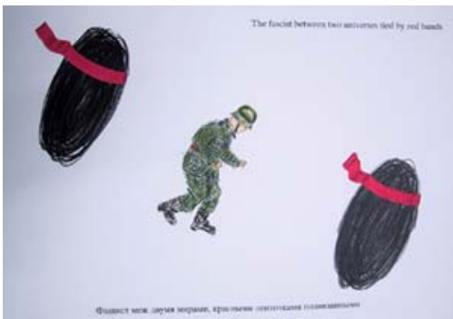
« Le fasciste entre deux univers à ruban rouge », 2005